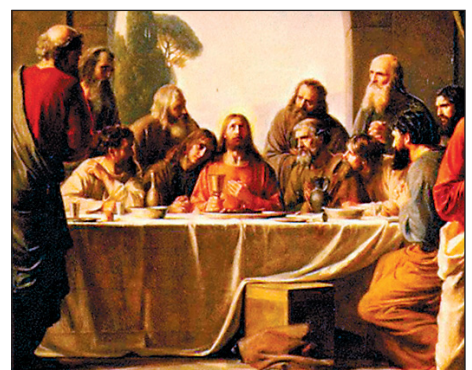
Coordina: E. Krause. Dibujos: qui Textos: M a Lourdes Sanz y Amaya García / EL MUNDO

La doctrina cristiana se rige por los principios recogidos en la Biblia, que se divide en dos partes (Antiguo y Nuevo Testamento) y recoge las enseñanzas predicadas por Jesucristo.