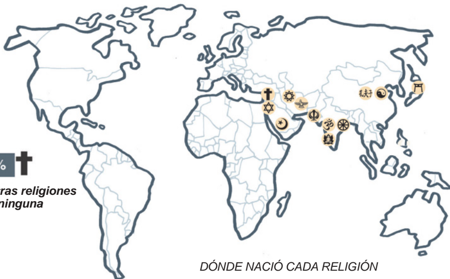
DÓNDE NACIÓ CADA RELIGIÓN